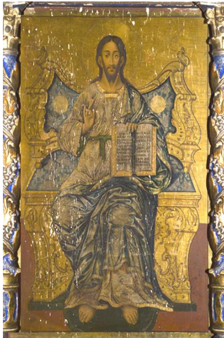
Icoana Iisus Învățător