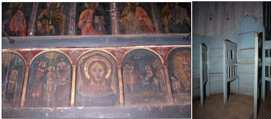
Strane vechi, decorate cu rozete și baluștri

Iconostasul bisericii impresionează prin simplitatea ansamblului și prin proporțiile sale echilibrate, armonizate cu cele ale lăcașului. Icoanele sunt dispuse sub arcade semicirculare care se desfășoară într-un ritm egal. Ușile împărătești, lipsite total de sculptură decorativă, înfățișează scena Bunei Vestiri , momentul-cheie al lucrării Mântuirii. Artă zugravului – activ probabil în prima jumătate a sec. al XIX-lea – este modestă, dar suplinită de sinceritatea expresiei și modalităților plastice.