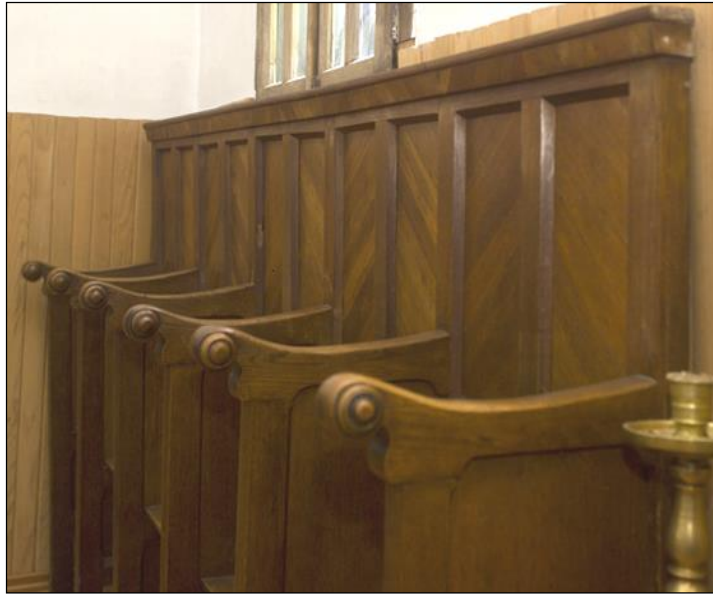
Strane din sec. XIX