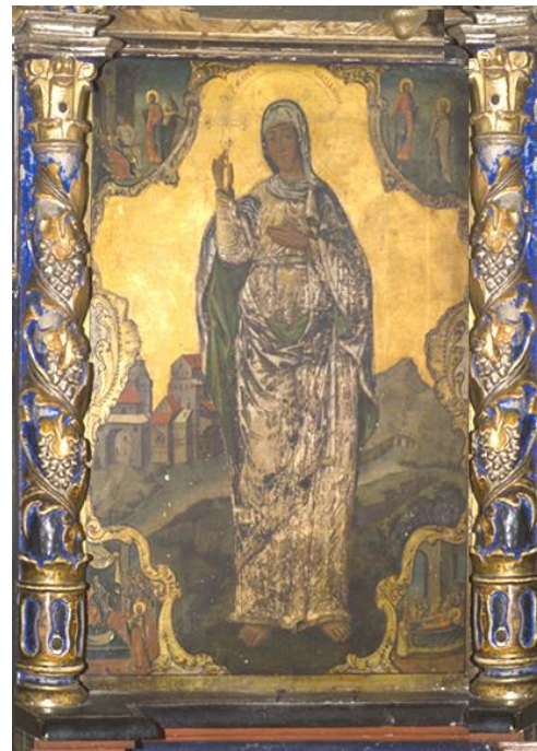
Icoana de hram Sfânta Maria Magdalena